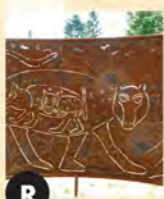
R Paravents - I - II - III (2013) Michel Beaudry