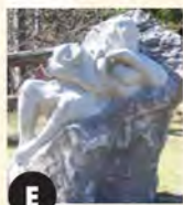
E La Mère du Nord (2005) Claude Desrosiers