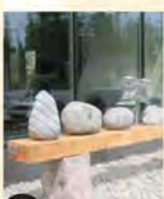
K La table est mise (2007) Jean Bisson Biscornet