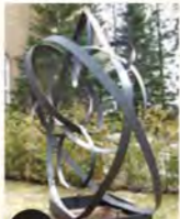
N Cosmogonia (2009) Robert Clément