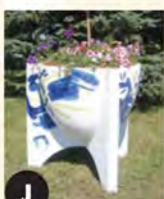
J Jarre tripode (2007) Alain-Marie Tremblay