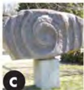
C La Porte (2000) Jean Bisson Biscornet