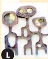
L Bronze (1975) Bernard Chaudron