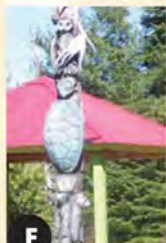
F Le Guerrier Pacifique (1998) Normand Ménard