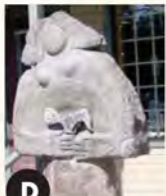
D Le Réveil (2002) Jean Bisson Biscornet