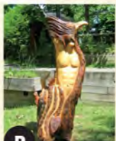
P Phoenix de l'amourhomme (2011) Bendigo