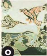
O Autour de mon jardin (2010) René Derouin