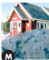
M La locomotive pétrifiée (2009) Daniel Hogue