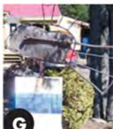
G El pescado harto (1995) Yves Gélinas