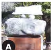
A La vérité (1995) Jean Bisson Biscornet