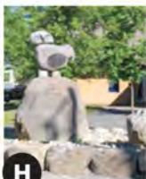
H L'Oracle (2005) Jean Bisson Biscornet Patrice LeGuen