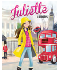
JULIETTE À LONDRES Rose-Line Brassat