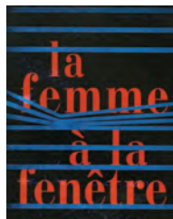
LA FEMME À LA FENÊTRE A.J. Finn