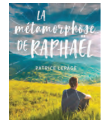
LA MÉTAMORPHOSE DE RAPHAËL Patrice Lepage