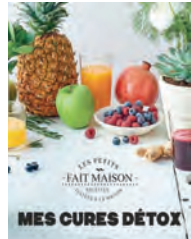
MES CURES DÉTOX Hachette cuisine