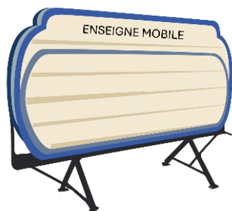
Enseignes interchangeables ou modifiables